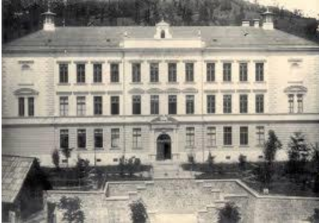
Stavba realke pred 1. svetovno vojno

V petstoletni zgodovini Idrije pripada šolstvu pomembno in častno mesto. Dejstvo je, da je bila vednost o vrednosti izobraževanja in znanja vseskozi globoko vgrajena v sistem vrednot rudarskega življa. Težnja po razgledanosti je nedvomno izvirala iz povezanosti rudnika z velikim svetom, soočanja s tehniškimi dosežki in prisotnosti uglednih izobražencev, ki so spodbujali idrijsko vedoželjnost in nagnjenje k inovativnosti zato ni naključje, da je bila ravno v Idriji 1901 ustanovljena prva slovenska realka . Od prvih pobud pa do njene ustanovitve je preteklo dolgih tristo let.